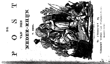
De Post van den Neder-Rhijn deel V

Bijna van week tot week wordt het politieke standpunt van De Post van den Neder-Rhijn geanalyseerd, gegroepeerd naar de verschillende zwaartepunten. Aanvankelijk ligt de nadruk op de buitenlandse politiek, met name de Vierde Engelse Oorlog, en wordt het blad gekenmerkt door een sterke anglofobie en de neiging tot het denken in politieke complottheorieën. Na het desastreuze verloop van de oorlog verschuift het accent echter naar de binnenlandse ontwikkelingen. Interessant is Theeuwens analyse van de rol van De Post van den Neder-Rhijn in de patriottentijd in Utrecht, de thuisbasis van 't Hoen. Eerst stelt 't Hoen zich gereserveerd op tegenover het naar zijn oordeel al te snel met harde middelen doordrukken van de democratische eisen, bijvoorbeeld bij de revolutionaire journalée van 11 maart 1785, wanneer patriotten de raadsmeerderheid onder dreiging met geweld