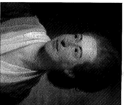
Belle van Zuylen

lende standpunten. Zo verwerpt ze Lockes idee van een tabula rasa resolut. Volgens haar kan de mens onmogelijk alle ideeën uit de zintuiglijke ervaring afleiden. Het idee van 'onvermogen' kan bijvoorbeeld onmogelijk op zintuiglijke waarneming worden gebaseerd en dus moet de mens wel aangeboren ideeën hebben. Net als De Neufville trekt ze fel van leer tegen de materialisten. Vooral La Mettrie, auteur van L'Homme Machine (1747), moet het ontgelden: 'i gevoelen, dat de mensch