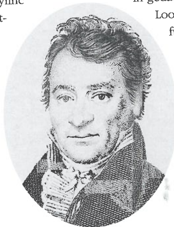
Hendrik Tollens

subtielere wijze. In 1812 schreef hij het jubelvers 'Op den eersten tand van mijn jongstgeboren zoontje'. Het gedicht is vaak afgedaan als een voorbeeld van brave huiselijkheidspoëzie, maar het kan even goed als een vorm van verzetspoëzie worden beschouwd. Het wemelt van de verwijzingen naar een zuiver geweten en rechtvaardig verzet. Wat te denken van de volgende regels: 'En, wie u 't eerloos hoofd moog biën, / Laat jongen, laat uw tanden zien. / Waar eer en pligt het vergen'. Ofwel: wanneer iemand zich tegenover zijn zoon zich daartegen opstelt, dan mag de zoon zich daartegen verweren. Het kan bijna niet anders, of Tollens had de actuele politieke situatie in gedachten.