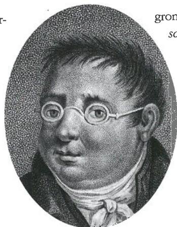
Jan Fredrik Helmers

Tal van schrijvers verheieven hun stem tegen het Franse gezag en sprongen in de bres voor het vaderland. Zelfs tijdens de Inlijving, toen strenge censuurwetten werden ingesteld, lieten zij zich niet de mond snoeren. Het bekendste verzetsgedicht is De Hollandsche natie uit 1812 van Jan Fredrik Helmers (1767-1813).